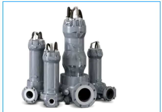
La serie Grey