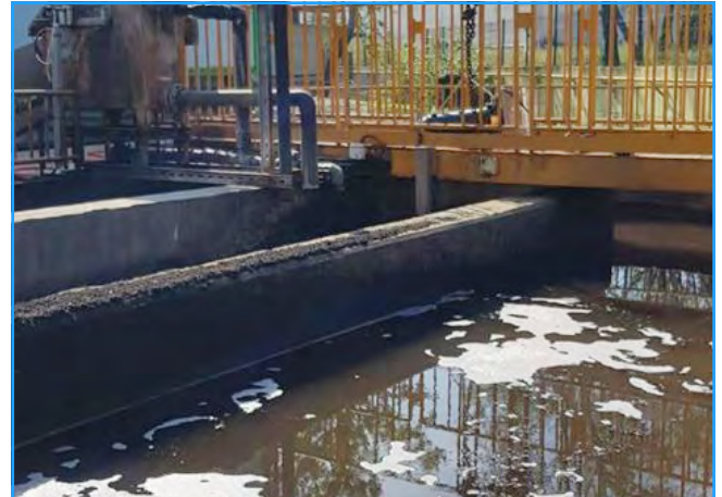
Eines der Klärbecken der Anlage

Der Wirkungsgrad der Motoren der Premium-Klasse IE3 garantiert hohe Leistung bei niedrigem Energiebedarf, was niedrigere Betriebskosten und allgemeine Zufriedenheit des Kunden bedeutet.