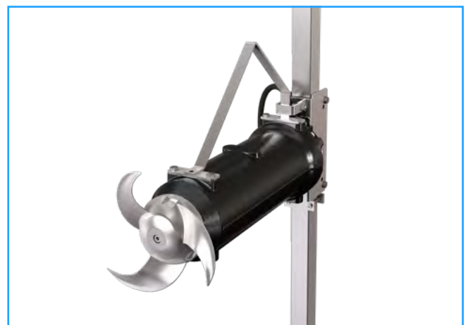
ZMD 030D A 3/6